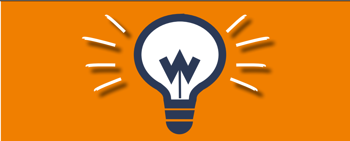
Illustration: Eva Neumann