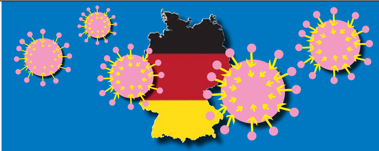
Illustration: Eva Neumann